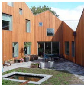
2015 Kræftens Bekæmpelse Gormsvej 15 Arkitekt: Adept