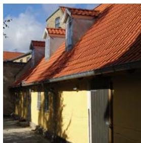
2013 Købmandsgård fra 1700-tallet Allehelgensgade 4

Jeg / vi ønsker at blive medlem af: Foreningen for Bygnings- og Landskabskultur i Roskilde