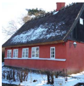
2016 L.A. Rings Atelier Brøndgade Foreningen L.A. Rings Venner