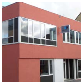
2014 HK Sjælland Hersegade 13 Arkitekt: Mangor & Nagel